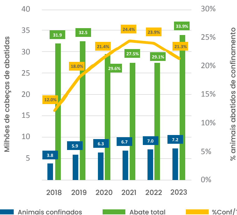
Tabela 1. Número de bovinos confinados no Brasil e participação nos abates, de 2018 a 2023.

Fonte: Censo DSM-Firmenich de confinamento (animais confinados) e IBGE (abate total) (2024).