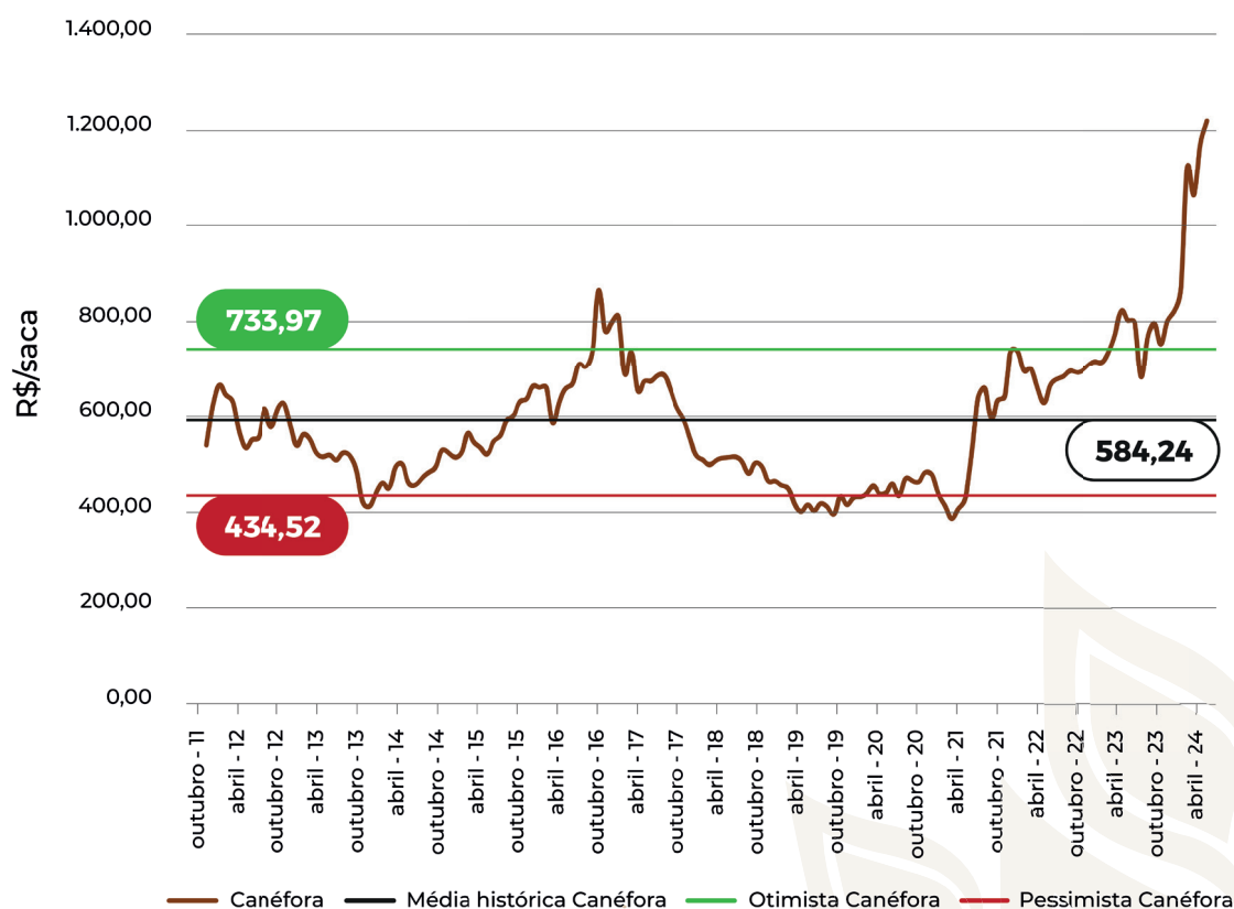
Gráfico 2 - Preços reais do café canéfora (conilon) de outubro de 2011 a julho de 2024 (em R$ por saca).

O Gráfico 2 apresenta a evolução dos preços reais do café conilon, que, recentemente, mostrou uma trajetória semelhante do arábica. Em apenas 18 períodos os preços do conilon superaram o indicador de referência otimista, enquanto em 85 períodos ficaram abaixo da média real. Os melhores cenários para o conilon ocorreram em quatro meses de 2016 e desde maio de 2023.