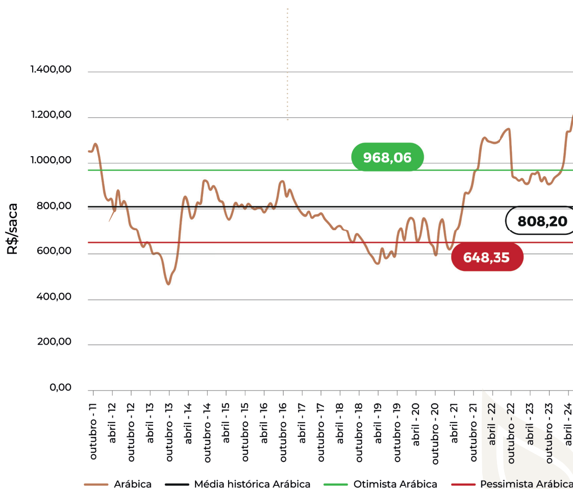
Gráfico 1 - Preços reais do café arábica de outubro de 2011 a julho de 2024 (em R$ por saca).